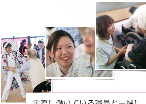
実際に働いている職員と一緒に食事をしたり、話を聞いたり…